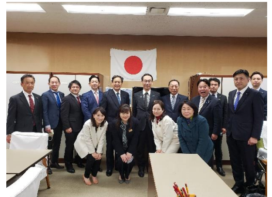
閉会后知事を囲んで会派のメンバーと