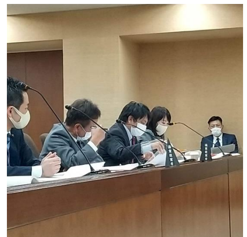
提案者として委員会での質疑に応じました

などあり、改正の必要がありました。最大会派からも同趣旨の議案が提出されたため、我が会派の案は否決となりましたが、県民の皆様の暮らしの安全・安心に繋がる改正となりました。施行は、令和3年4月1日となります。