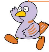
埼玉県マスコット 「コバトン」