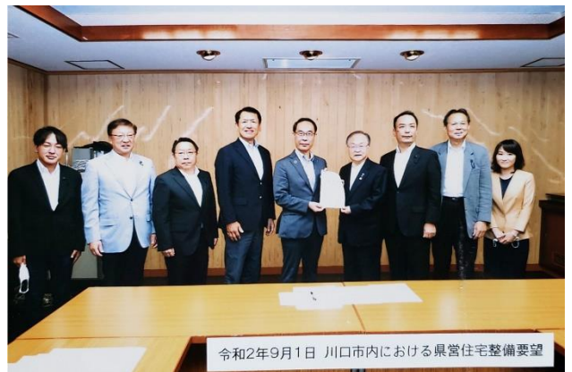
令和2年9月1日 川口市内における県営住宅整備要望