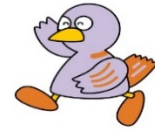
埼玉県マスコット 「コバトン」